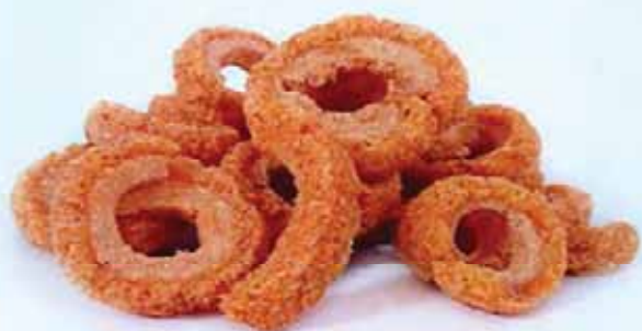
Torrezno Sabor Campesino