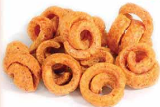
Tiras de Jamón