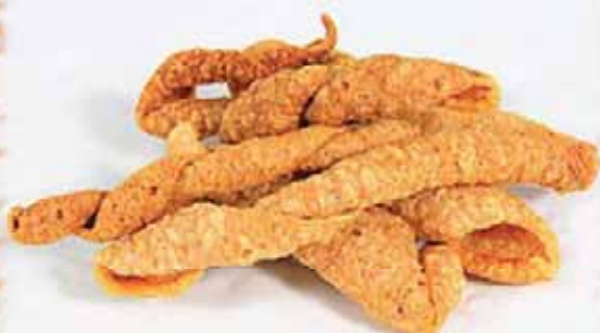
Churros de Jamón