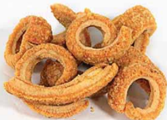
Torrezno Sabor Barbacoa