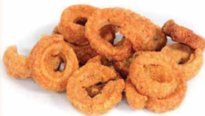
Torrezno Sabor Ibérico